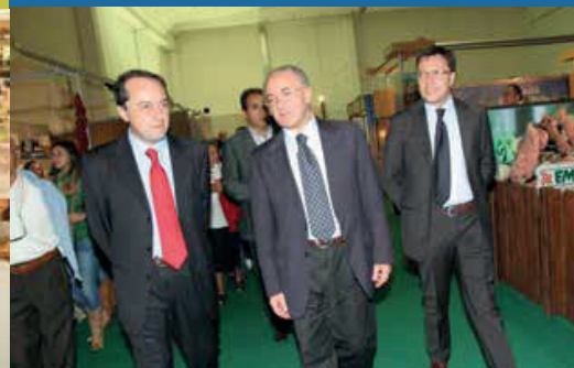
VINCENZO DE LUCA PER INAUGURAZIONE