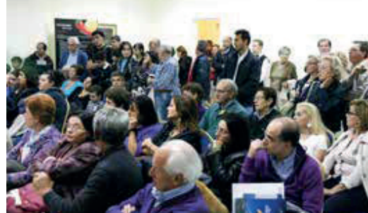
LABORATORI DEL GUSTO

Punto di incontro tra domanda e offerta sono i saloni del Grand Hotel di Salerno che divengono nelle giornate di Cibo e Dintorni il luogo ideale di confronto tra le aziende sui gusti e le richieste commerciali dei mercati ad alto potenziale: nelle precedenti edizioni le aziende partecipanti hanno potuto incontrare operatori provenienti da Giappone, USA, Australia, Francia, Spagna, Svizzera, Germania, Inghilterra, Svezia, Polonia, Belgio, Grecia, Russia, Turchia, Bulgaria, Ungheria, Israele, Portogallo, Italia , per citarne alcuni.