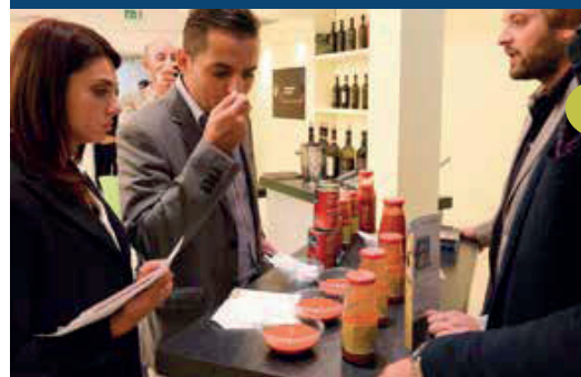
BUYER NEGLI STAND