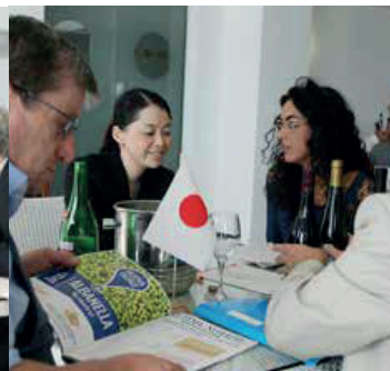
THE OPENER CO. GIAPPONE