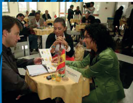
ITALIBERICA ALIMENTACION SPAGNA