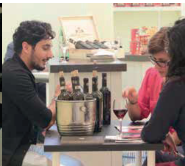
BUYER NEGLI STAND