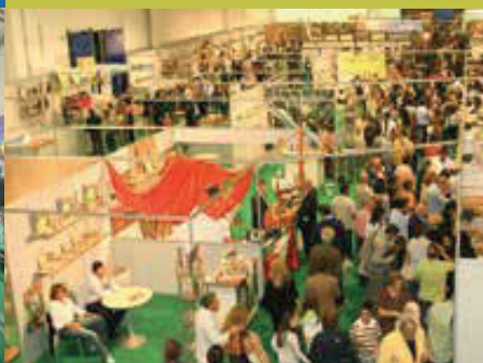
AREA INTERNA 3,500 MQ