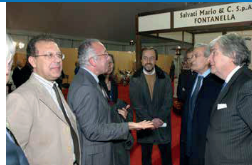
PASTIFICIO AMATO INCONTRA CARNIATO EUROPEO ed entra in 6000 ristoranti francesi - 2004