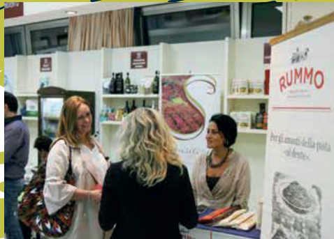
BUYER NEGLI STAND